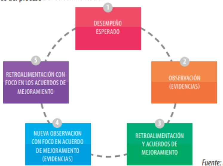
Figura 1: Pasos del proceso de retroalimentación

El esquema propone un proceso de carácter cíclico. Esto significa que cuando se completa el ciclo, según lo propuesto en el esquema, y se vuelven a mirar los referentes de desempeño, debería observarse una mejora en los mismos. Para que esto suceda, se requiere que se efectúen todas las acciones indicadas en el ciclo.