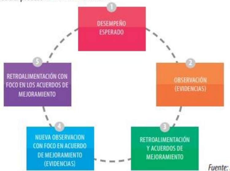
Figura 1: Pasos del proceso de retroalimentación

El esquema propone un proceso de carácter cíclico. Esto significa que cuando se completa el ciclo, según lo propuesto en el esquema, y se vuelven a mirar los referentes de desempeño, debería observarse una mejora en los mismos. Para que esto suceda, se requiere que se efectúen todas las acciones indicadas en el ciclo.